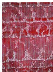
FOTOGRAFIA MACROSCÓPICA FOTOGRAFIA MICROSCÓPICA