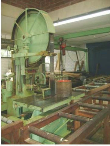
Sierra sin fin para ensayos de corte de madera.